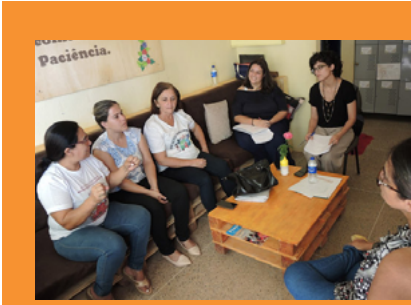
Grupos focais da escola Antônia Suzetede Olivindo da Silva