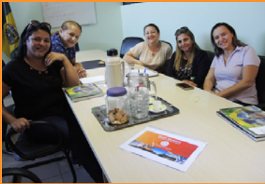
Reunião com Secretários do Município de Tianguá

Nas atividades de pesquisa, os olhos dos alunos entrevistados brilharam quando escutaram que teríamos implementação e formação em Rádio Escolar. Com alunos integrados e en-