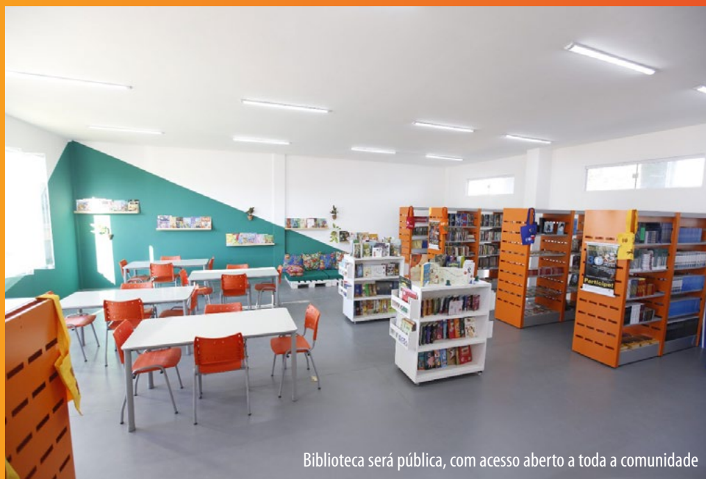
Biblioteca será pública, com acesso aberto a toda a comunidade