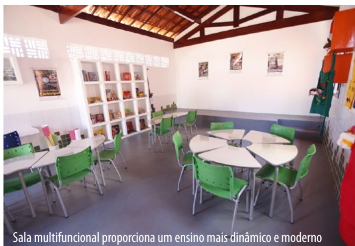
Sala multifuncional proporciona um ensino mais dinâmico e moderno

Biblioteca e salas técnicas com design inovador marcam a semana de entrega das obras em Serra do Mel