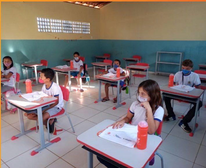
Salas montadas para respeitar o distanciamento de forma segura