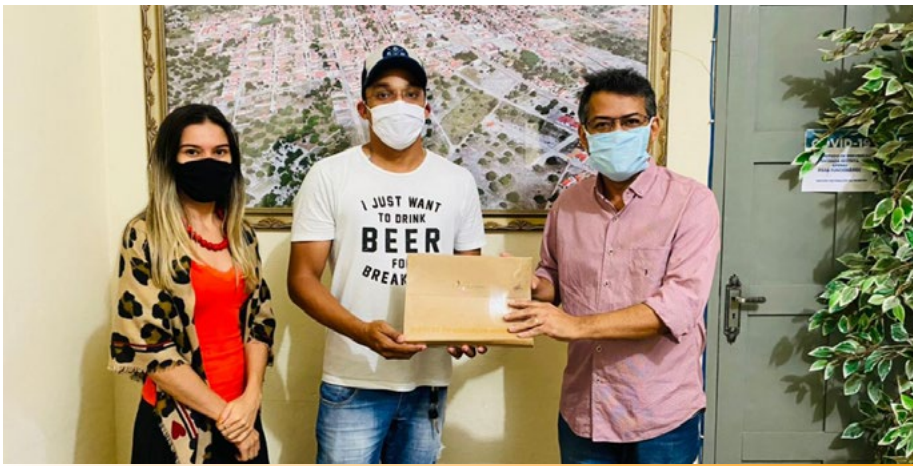
A chegada dos Kits de Práticas em Educação Ambiental em Lagoa Nova/RN vai gerar uma nova mobilização nas secretarias do município