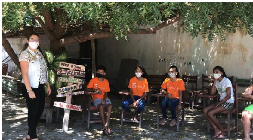
Semana da Árvore em Tianguá, CE