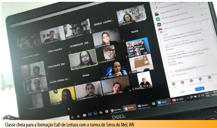
Classe cheia para a formação EaD de Leitura com a turma de Serra do Mel, RN