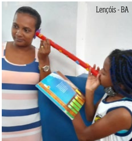
Lençóis - BA

A Escola Municipal São Pedro, em Balsas (MA), organizou um sarau literário com contação de histórias, apresentações teatrais e pinturas que coloriram a escola. Os alunos se fantasiaram de personagens, se divertindo na encenação de trechos literários e motivando os colegas a conhecerem os livros.