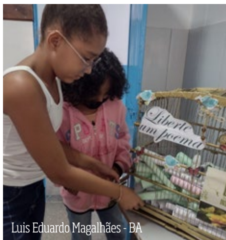
Luis Eduardo Magalhães - BA