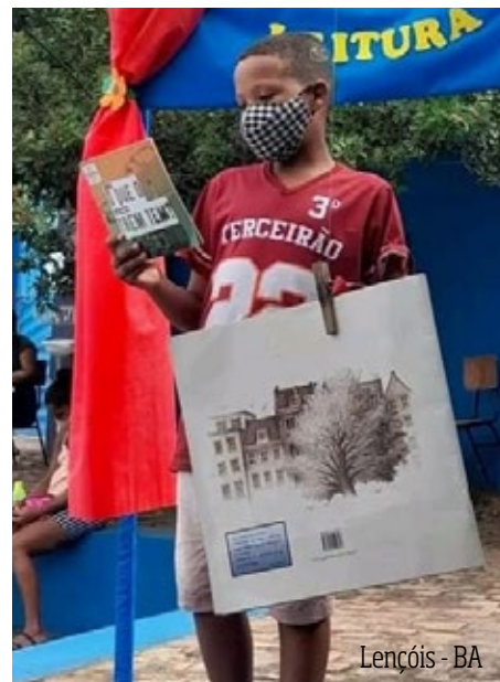
Lençóis - BA