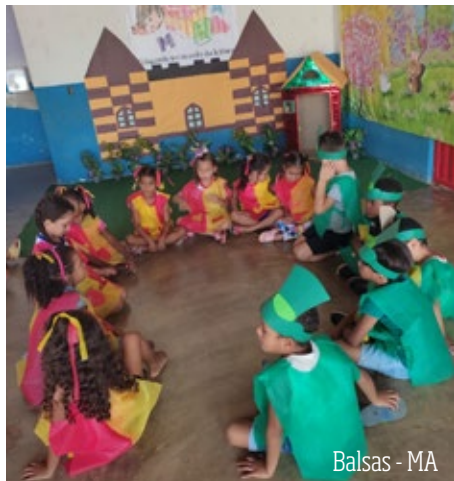
Balsas - MA

As ações de leitura literária têm se multiplicado entre as escolas parceiras do Programa de Desenvolvimento da Educação - PDE - por todo o Brasil. Os Anjos da Leitura provam, mais uma vez, serem agentes da disseminação do prazer literário e promovem atividades lúdicas e criativas que inserem os educandos no mundo da leitura! Acompanhe algumas dessas ações!