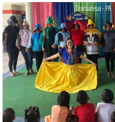
Tracuateua - PA