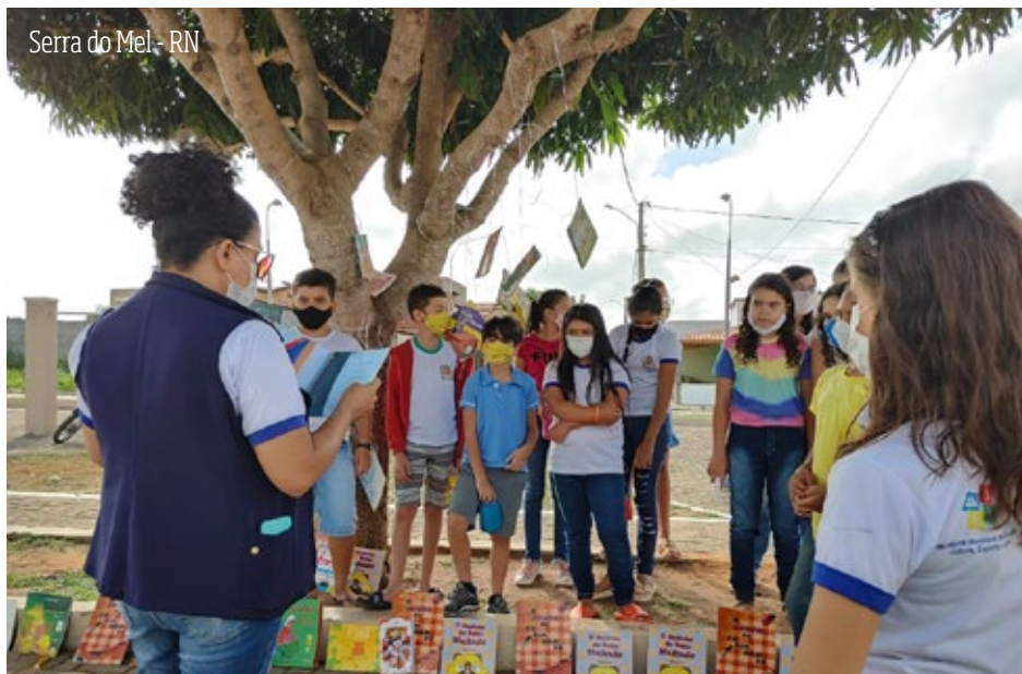
Serra do Mel - RN