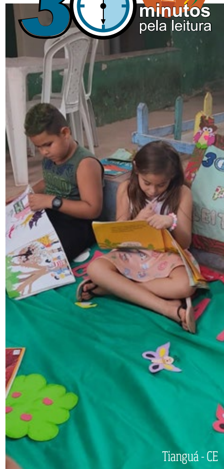
Tianguá - CE