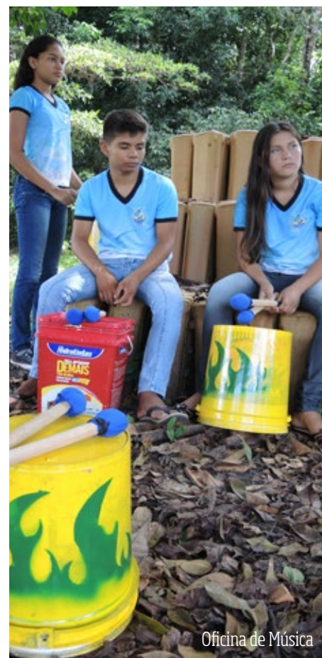
Oficina de Música