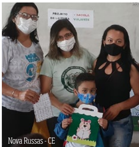
Nova Russas - CE

Na Unidade Escolar Madre Lúcia, em São Raimundo Nonato (PI), o livro A cesta da Dona Maricota , de Tatiana Belinky, foi trabalhado para discutir o tema da alimentação saudável com as crianças de forma lúdica. Os alunos demonstraram os conhecimentos adquiridos realizando uma contação por meio do teatro de fantoches.