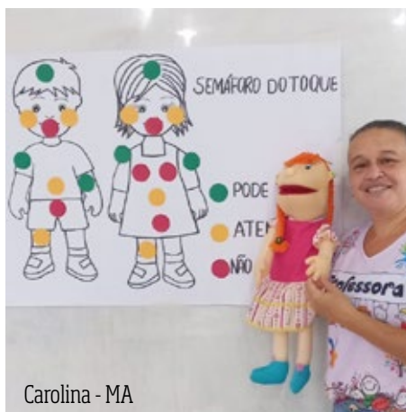
Carolina - MA