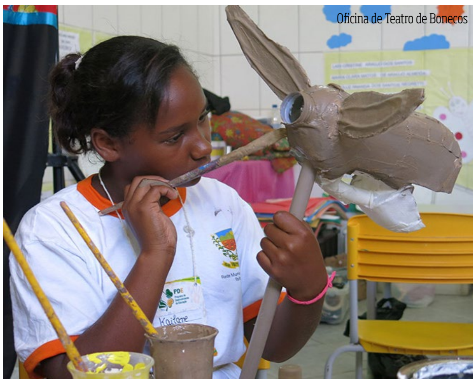
Oficina de Teatro de Bonecos

Dentro desse escopo, as linguagens artísticas trabalham, além de aspectos cognitivos, a sensibilização para as questões ambientais. A arte acolhe qualquer assunto. Não seria diferente com temas relacionados ao meio ambiente. "A utilização da arte pela Educação Ambiental é um meio de trabalhar a alegria, o lúdico, a beleza, o agradável e o criativo na abordagem e na construção dos principais conceitos da questão ambiental", segundo Eliane Ta Gein, engenheira e educadora ambiental, e acrescentaríamos, também, trabalhar o pensamento crítico, lembrando que as obras de arte em qualquer linguagem podem levantar questionamentos a respeito do ambiente em que vivemos, além de apresentar novas versões imaginadas e possíveis de mundo.