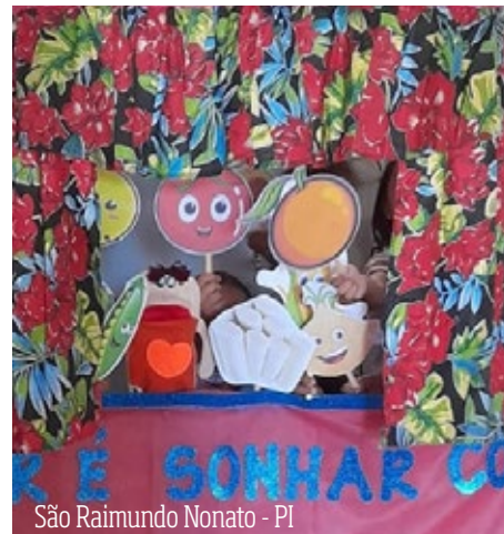
São Raimundo Nonato - PI

A Carroça Literária da Escola Municipal Maria Isabel da Silveira, em Lençóis (BA), continua levando literatura para as ruas. Com cantoria, atraem os transeuntes e convocam as famílias a saírem de suas casas para conhecer o acervo literário da escola com sussurros poéticos, roda de adivinhas e contação de histórias.