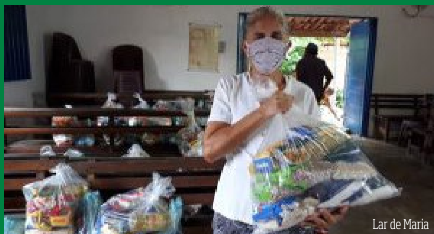
Lar de Maria

As doações do IBS e de seus parceiros continuam firmes numa campanha de segurança alimentar durante a pandemia! pág. 3