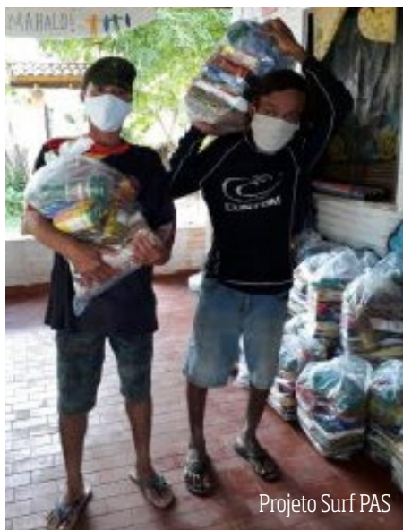
Projeto Surf PAS