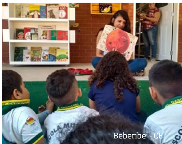
Beberibe - CE