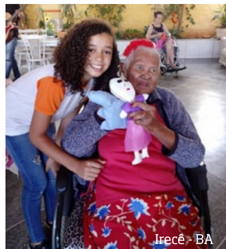
Irecê - BA

Final de ano com muitas emoções e literatura com os nossos Anjos da Leitura!