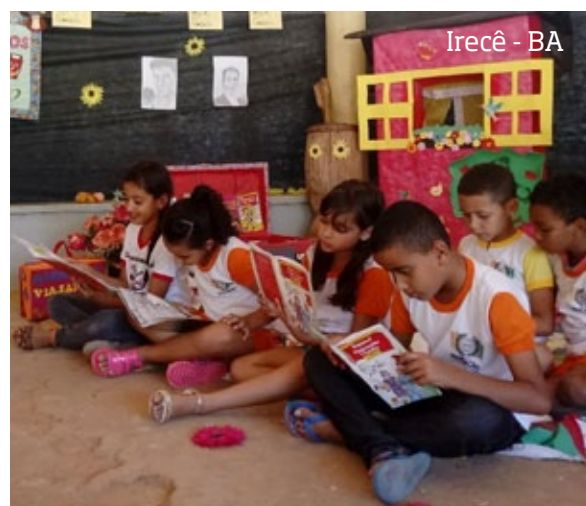
Irecê - BA