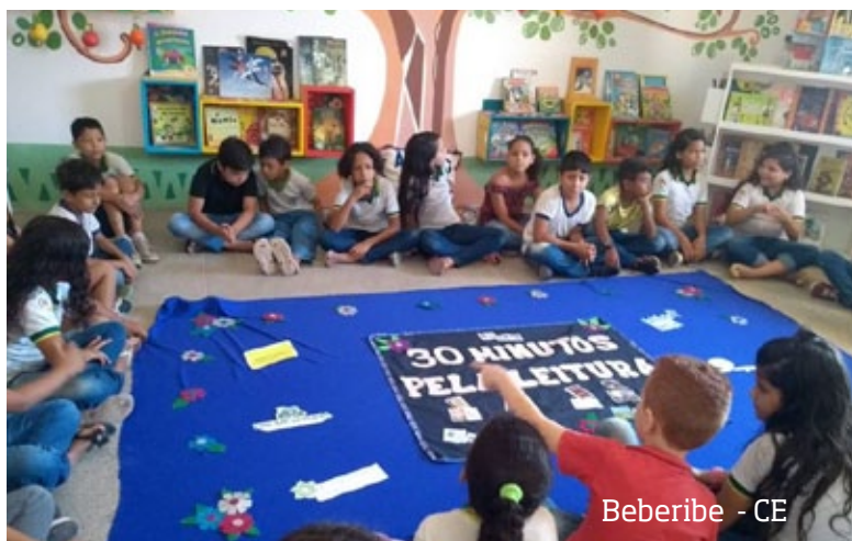
Beberibe - CE