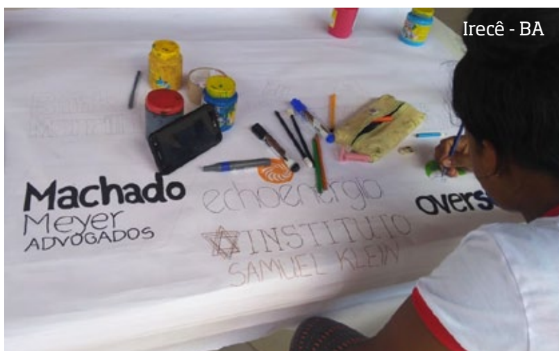
Irecê - BA