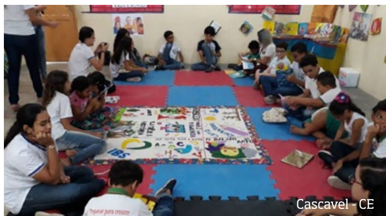
Cascavel - CE

Escolas apoiadas pelo Instituto Brasil Solidário mobilizaram-se para homenagear os financiadores dos programas do Instituto com ações em todo o país! Durante a culminância do Projeto 30 Minutos pela Leitura, muitas atividades utilizando os materiais doados com aporte dos financiadores!