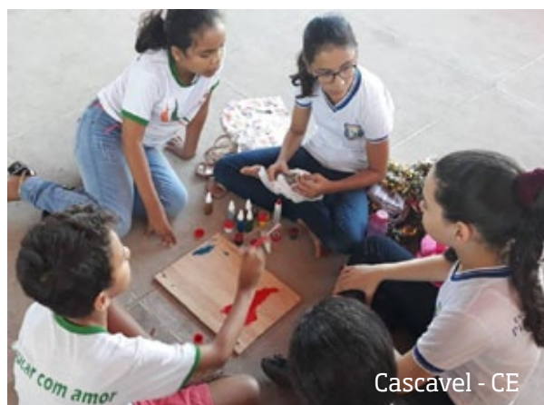
Cascavel - CE