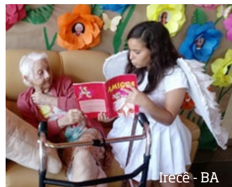
Irecê - BA