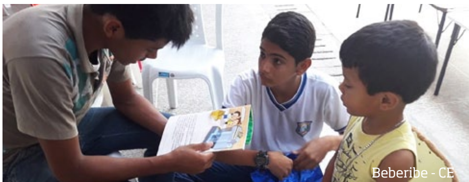
Beberibe - CE