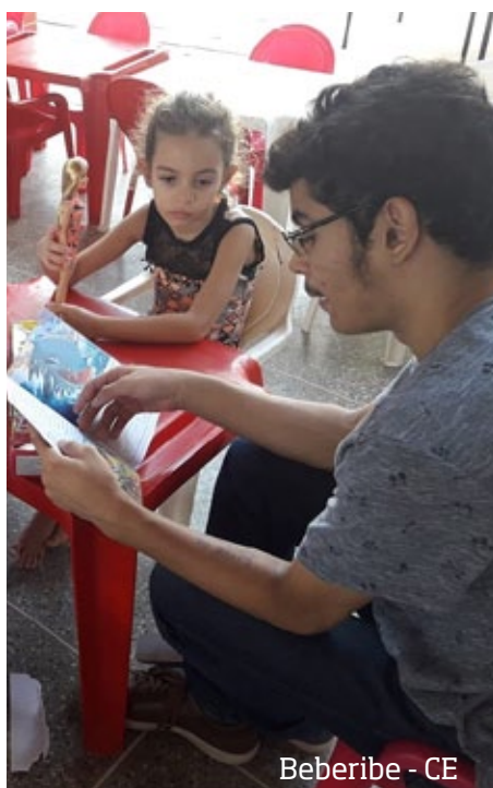
Beberibe - CE