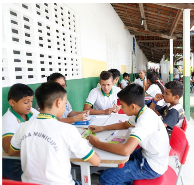
Jugar y aprender, con un horario previamente acordado con los municipios.

Siempre hemos creído en la importancia del empeño de todos en la promoción de actividades que incentiven la interacción entre la comunidad escolar para la mejora de la enseñanza pública. Juntos, profesores, gestores, coordinadores, gestores públicos y sociedad civil, y los estudiantes, por supuesto, pueden buscar soluciones y desarrollar actividades que colaboren con la mejora del Índice de Desarrollo de la Educación Básica (IDEB). De este modo, contribuirán también, por consecuencia, con la elevación de los índices sociales del país.