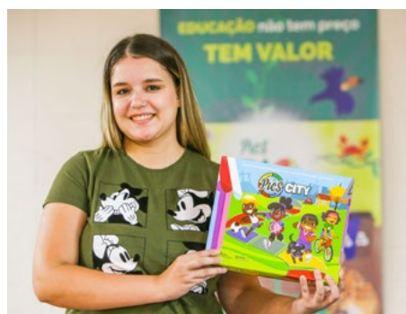
Professores tiveram o 1º contato com os jogos