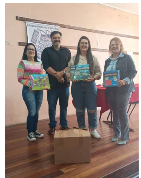
Recebendo os jogos e multiplicando

concretas. "Os alunos começam a pensar antes de gastar, a conversar sobre isso em casa e a se posicionar. São escolhas que fazem diferença na vida deles", diz a professora, que mostrou como a iniciativa de um docente pode atravessar os muros da escola e transformar a educação de cidades inteiras.