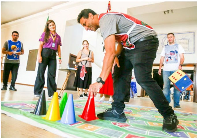
PIC$ City em tamanho ampliado