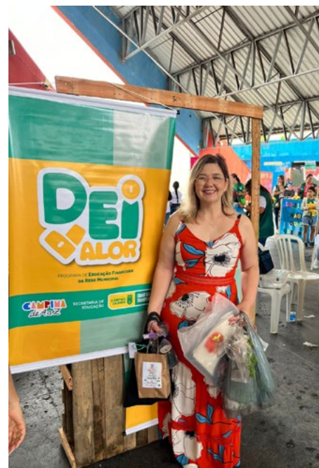
Acima, na feira. Abaixo, no Encontro do IBS.