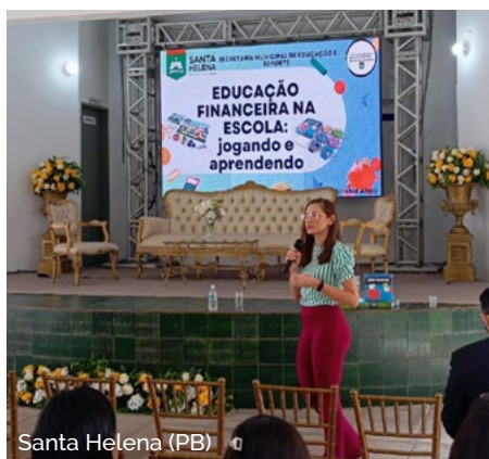
Santa Helena (PB)