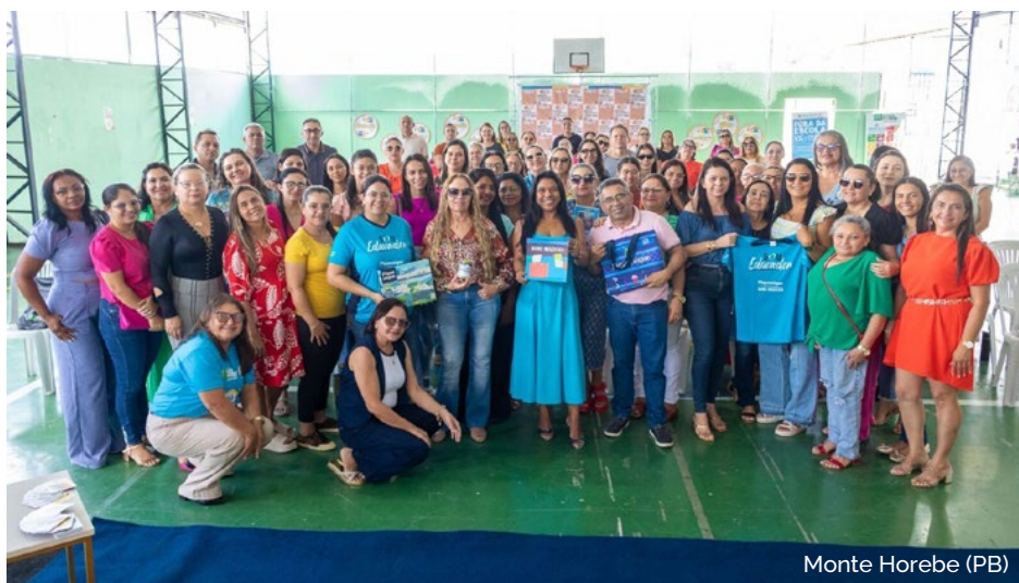
Monte Horebe (PB)

Piquenique e Bons Negócios invadem jornadas pedagógicas e entram no calendário de municípios