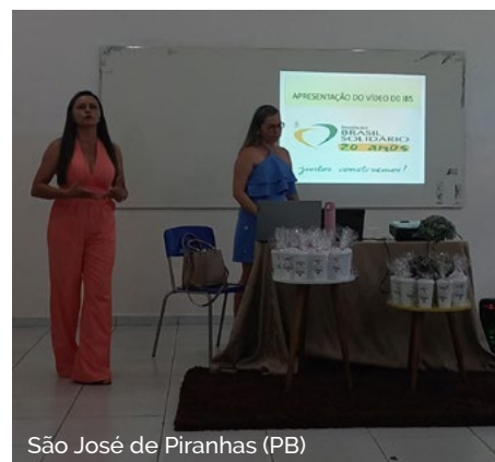
São José de Piranhas (PB)

Reforçando a parceria e o fortalecimento do projeto no estado da Paraíba, os municípios que já são parceiros registraram o trabalho dos mediadores na apresentação do projeto para toda a rede, reforçando sobre o início das formações para os educadores que não tiveram a oportunidade de passar pela capacitação EaD do IBS.