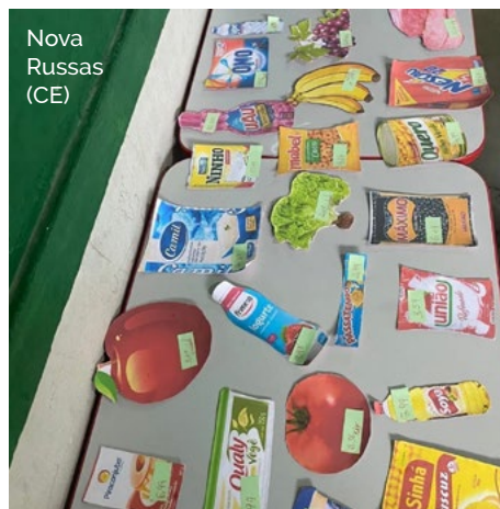
Nova Russas (CE)