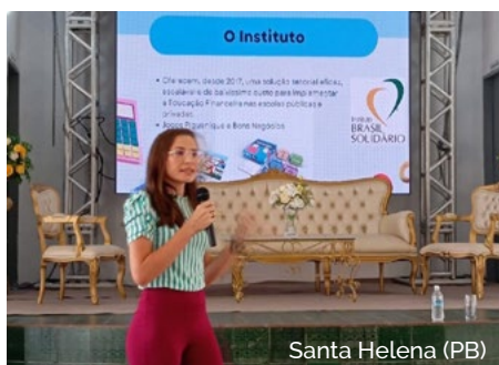
Santa Helena (PB)