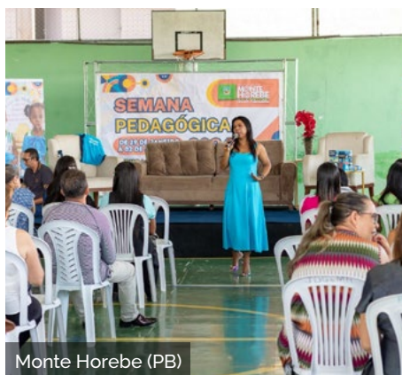
Monte Horebe (PB)