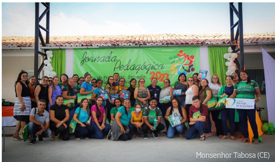
Monsenhor Tabosa (CE)

Municípios cearenses de Nova Russas, Catunda e Monsenhor Tabosa receberam ação presencial