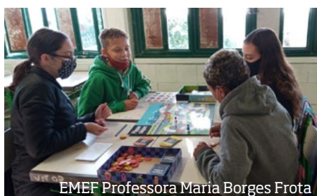
EMEF Professora Maria Borges Frota