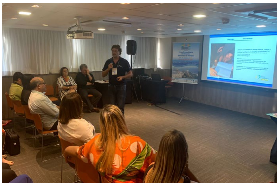
Gestores de diversos municípios fluminenses ficam interessados pela Educação Financeira com jogos após participação do IBS em fórum da Undime-RJ

dade de apresentar o projeto a gestores no Rio, diversos municípios fluminenses entraram em contato com o Instituto a fim de, em um futuro breve, também inscreverem educadores na formação EaD e contar com os jogos de Educação Financeira. Logo trataremos novidades!