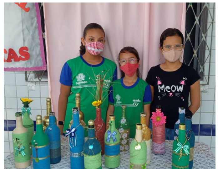
A feira em Queimadas/PB