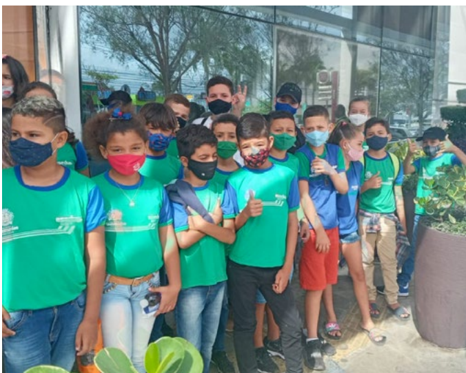
Muita empolgação na entrada do shopping