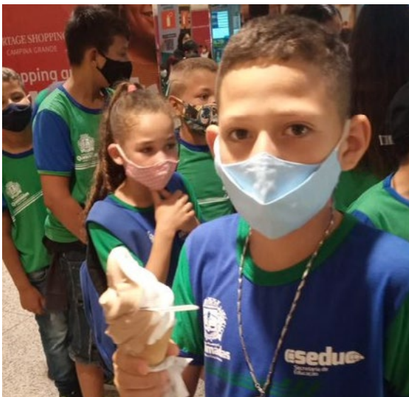
Passeio foi premiação pelo empenho