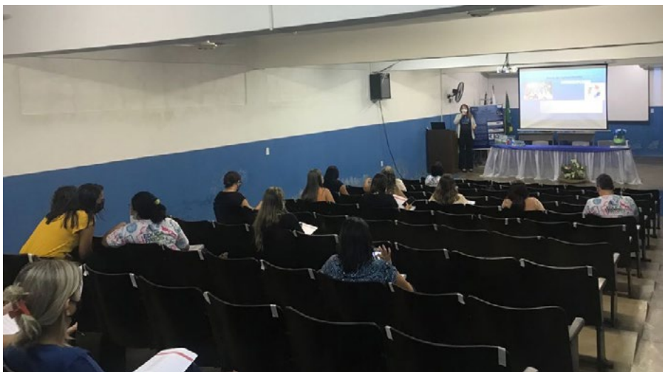
Evento contou com palestra de sensibilização, rodada de jogos e entrega de calculadoras

O evento, realizado no dia 31 de agosto, foi promovido pela Secretaria de Educação do Município e conseguiu reunir supervisores de todas