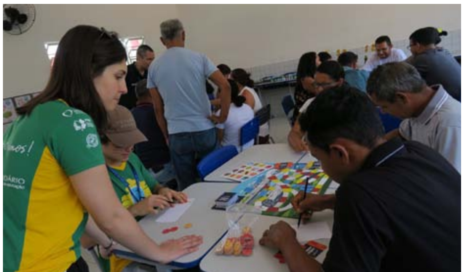
Formação de Ed, Financeira com professores da rede pública de Barreirinhas-MA, durante o Intercâmbio Solidário