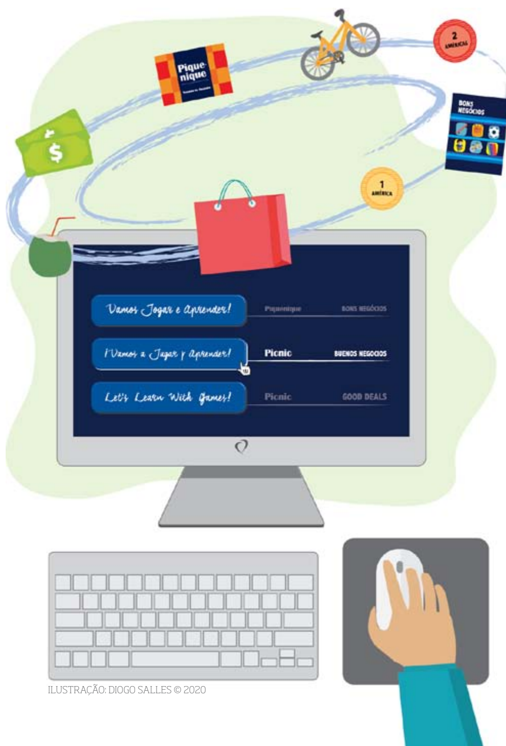
ILUSTRAÇÃO: DIOGO SALLES © 2020

Em tempos de escolas fechadas, navegar pelo site pode ser uma boa oportunidade para tirar dúvidas sobre os jogos, conhecer mais a fundo sobre o projeto, refletir sobre novos aprendizados e pesquisar sobre educação financeira. Vamos nessa?