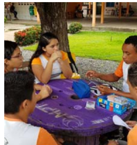
Jijoca de Jericoacoara/CE começa ano letivo preparando monitores