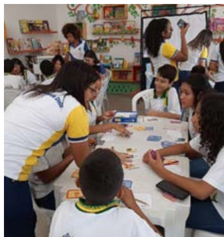
Cascavel/CE mobiliza grupo de monitores e educação financeira