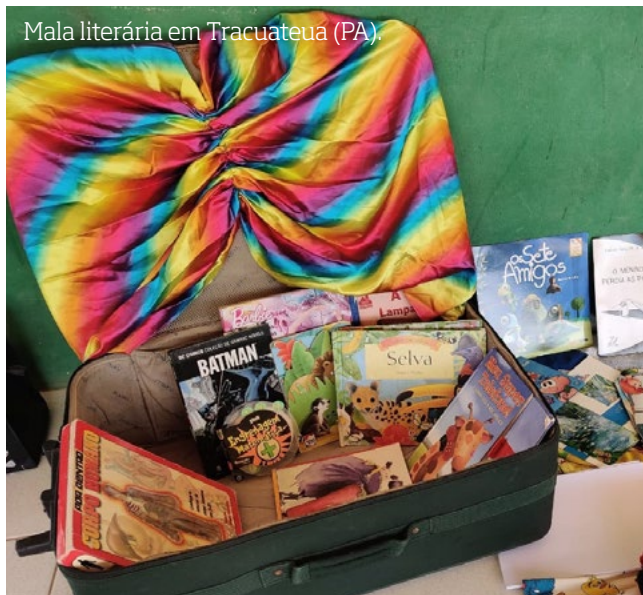
Mala literária em Tracuateua (PA).

Existem inúmeras formas de montar um painel, desde a utilização de cortiça, de tecido, uma pequena lousa, pregadores de roupa e também um painel imantado, que pode ser pintado diretamente na parede com tinta magnética . Use sua criatividade e crie um painel que anime os alunos a realizarem consultas periódicas!