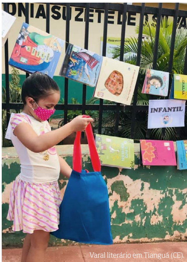
Varal literário em Tianguá (CE).

Organizar o espaço literário, ou seja, estender o tapete vermelho , torna-se mais que um lugar de encontro, é um espaço de reverência à leitura literária. É promover a formação do leitor literário neste encontro entre o livro, o mediador da leitura e o leitor, onde todos são iguais, são ouvintes, são leitores em formação.