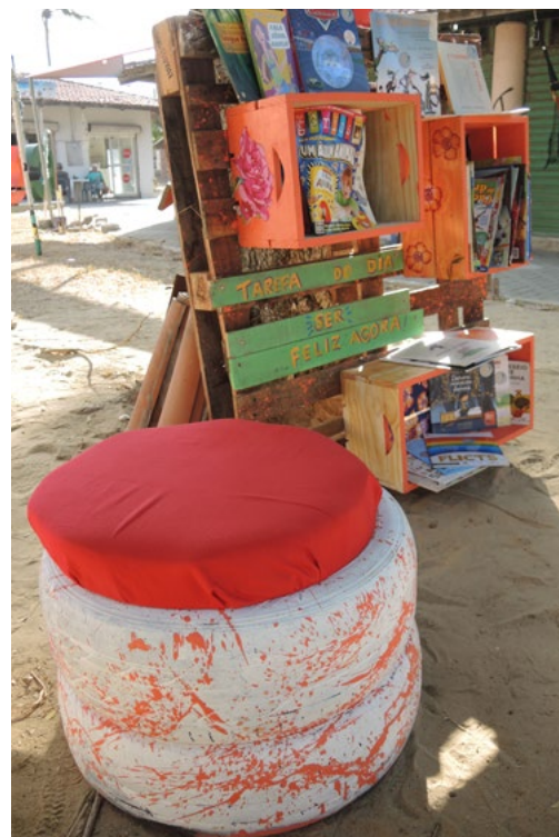
Pneus, caixotes e paletes foram usados para construir esse cantinho da leitura móvel para as atividades de incentivo à leitura do Projeto Cumcuco Bom de Bola , em Caucaia (CE).

Sua escola pode obter a Certificação Lixo Zero ao implementar práticas de sustentabilidade! Clique aqui e informe-se.