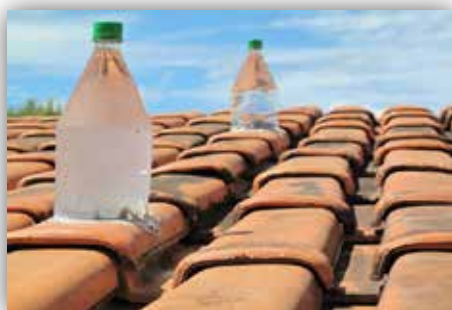
Sala de aula com iluminação sustentável